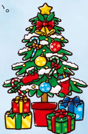
イオンウォーキング店内は、クリスマス色に!!